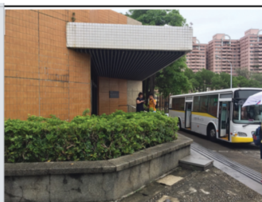
交大免費校車中正堂乘車處(往高鐵站)