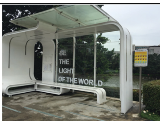
2路公車往返乘車處(位於竹湖前)